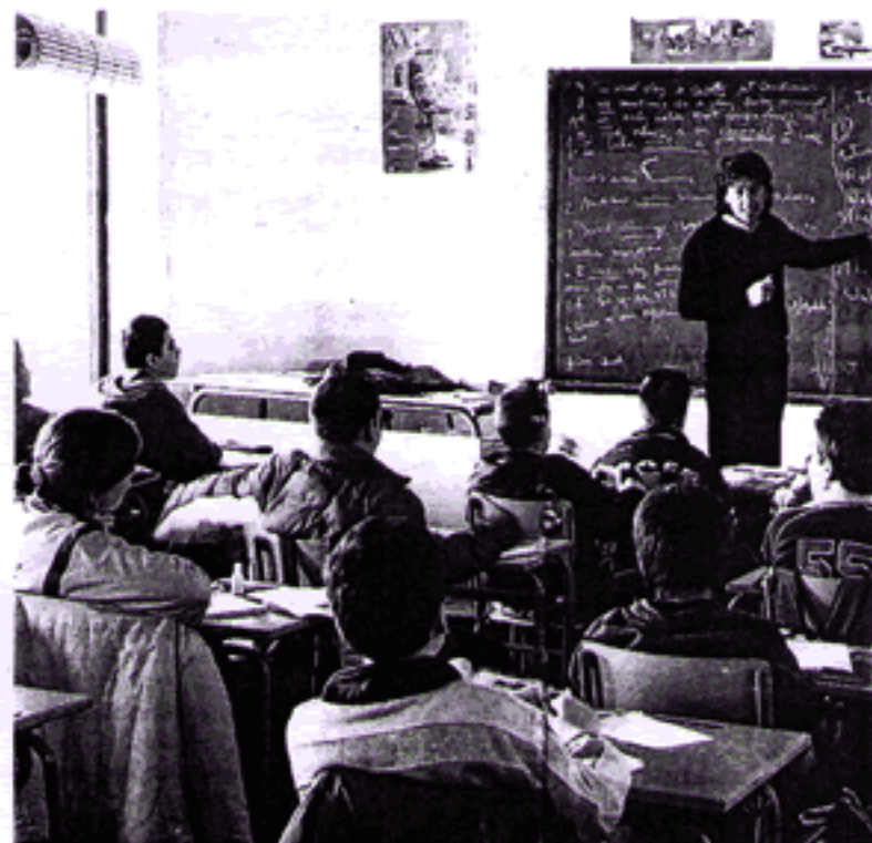
Un grupo de alumnos en clase en un colegio

La matrícula en educación terciaria, que abarca el nivel universitario y la formación profesional de ciclo superior, ha crecido en España un 21% entre 1995 y 2003. El aumento de los titulados ha sido también espectacular,